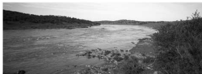
Guadiana 86-14 Duarte Belo 10 de maio - 23 de novembro 2014 Museu da Luz, Mourão